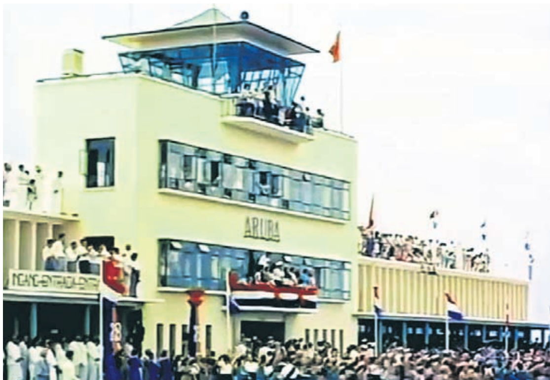
1955, third terminal building, arrival of Queen Juliana & Prince Bernhard